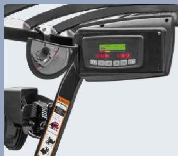
Display ben visibile