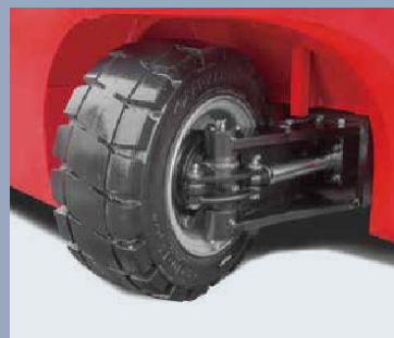
Ridotto raggio di sterzata